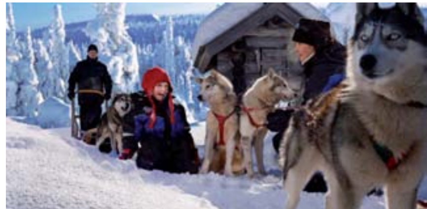
Safari con gli Husky