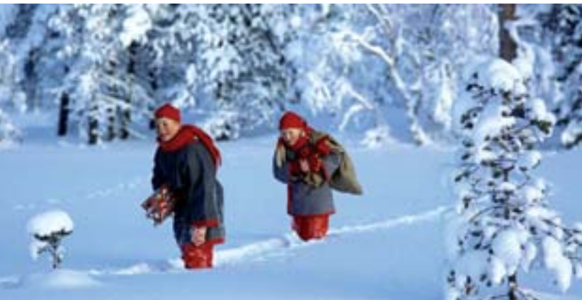
Gli aiutanti di Babbo Natale nella foresta

Voli diretti da Malpensa, assistenza in lingua italiana, escursioni, attività e abbigliamento termico incluso